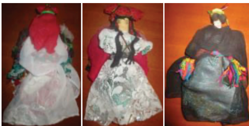
Figura 4, 5 y 6

Nota. Las figuras 1, 2 y 3 muestran el interior de la Asociación de Mujeres Artesanas de Khamlia, por Espinosa, 2021, pp. 184-185.